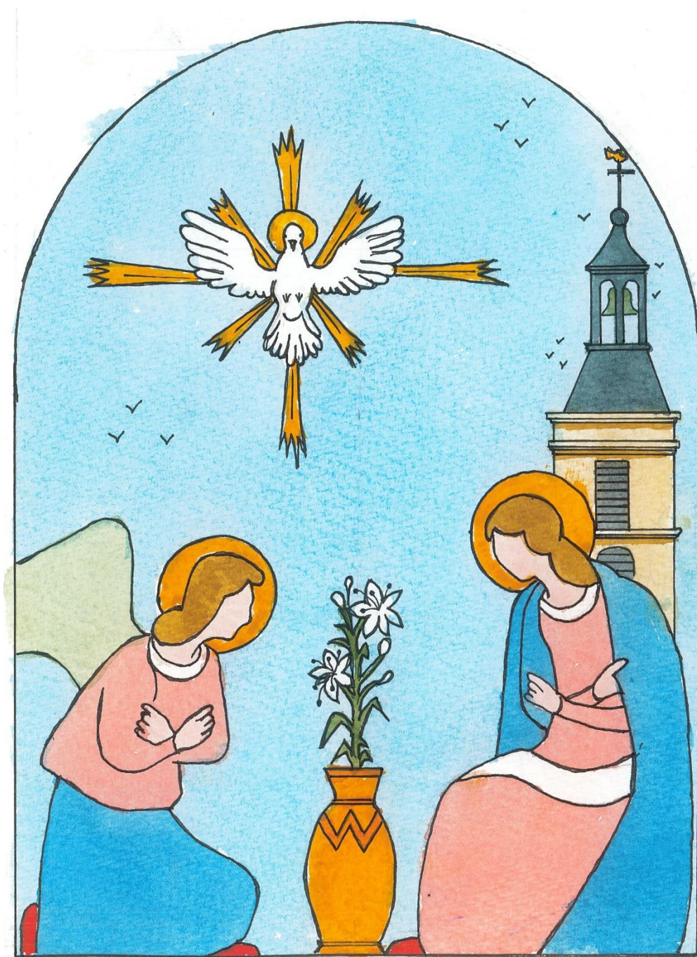
Dessin : Alain Sartelet

Dans notre église, deux tableaux évoquent la scène représentée ci-dessous.